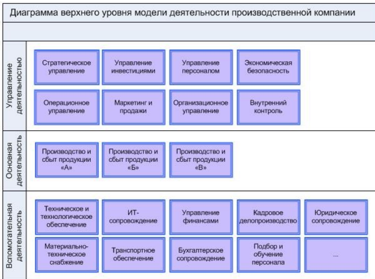
Рис. 2. Упрощенный пример диаграммы верхнего уровня модели деятельности (модели бизнес-процессов)